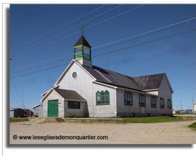
Saint-Étienne Obedjiwan (Obidjouane)

http://www.leseglisesdemonquartier.com/1766.html