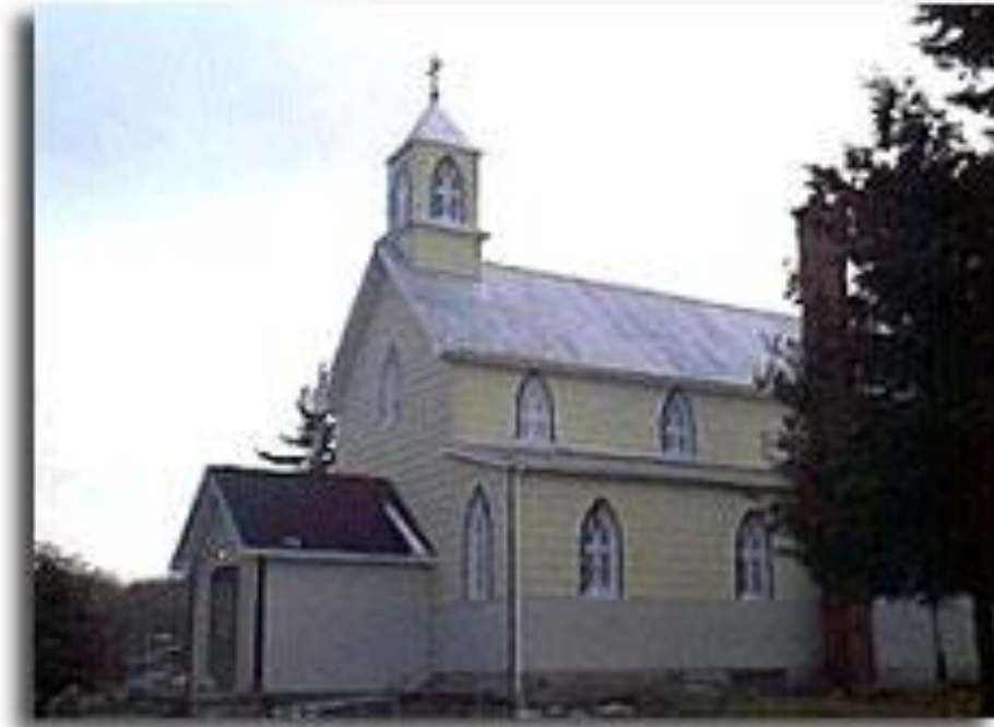
Saint-Jean-de-Brébeuf ( mission )