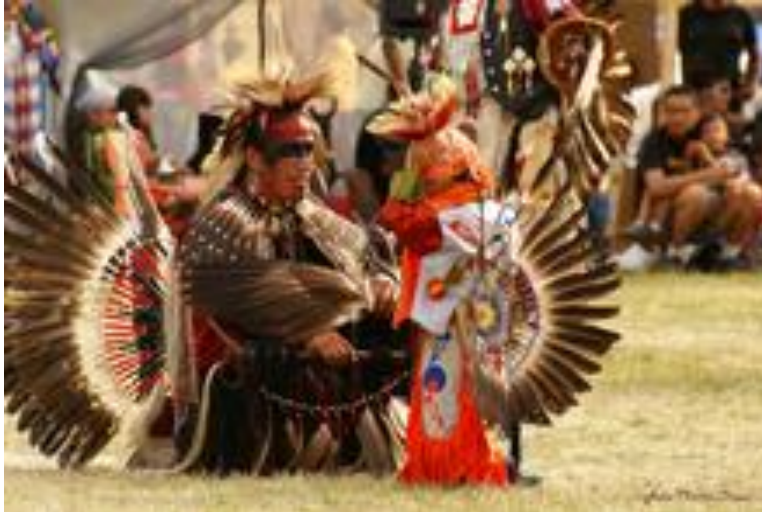
Membres de la nation atikamekw en costume traditionnel

https://fr.wikipedia.org/wiki/Attikameks