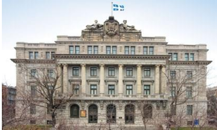
Archives nationales du Québec 1920

A dossier for the family lineage researchers who wish to know more about their ancestors, much beyond acts of baptism, marriage, death.