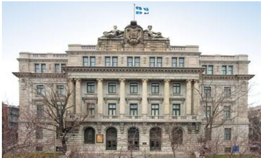
Archives nationales du Québec

A dossier for the family lineage researchers who wish to know more about their ancestors, much beyond acts of baptism, marriage, death.